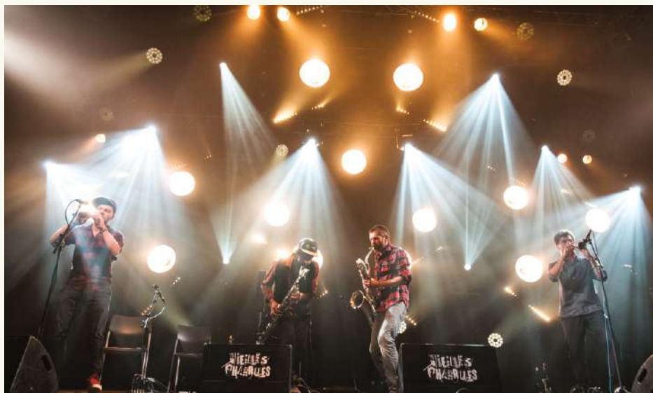
FESTIVAL LES VIEILLES CHARRUES 2019